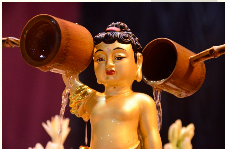
洗淨心垢，清涼舒暢

在如此神聖莊嚴的氣氛中，全體齊頌南無本師釋牟尼佛；師生依序上前進行浴佛。那專注的眼神、恭敬的禮拜、虔誠的儀軌，令人深深動容；正因態度如此虔敬，眾人好似經歷心靈的沐浴，蒙受佛光加被，頓覺清涼舒暢。