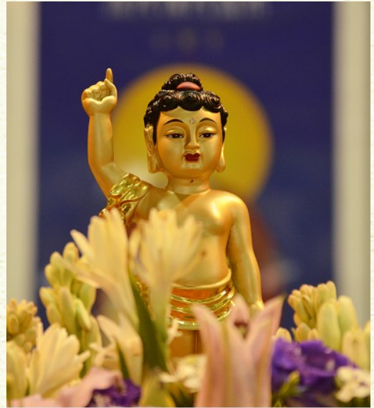
降生人間的釋迦牟尼佛，一手指天， 一手指地。